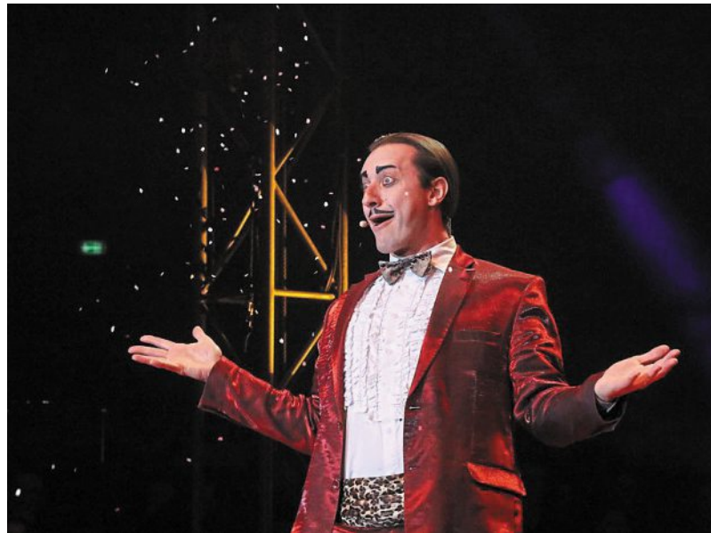
Coperlin et son humour potache ont fait hurler de rire les presque 19 000 spectateurs du festival.