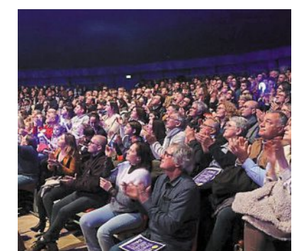
Cette 10 e édition du Festival a atteint des records de fréquentation avec près de 19 000 personnes accueillies sous le chapiteau.