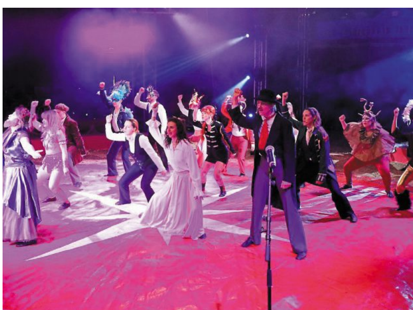
La troupe de BSpectaculaires a présenté des extraits de sa comédie musicale « The greatest showman » devant plus d'un millier de spectateurs.