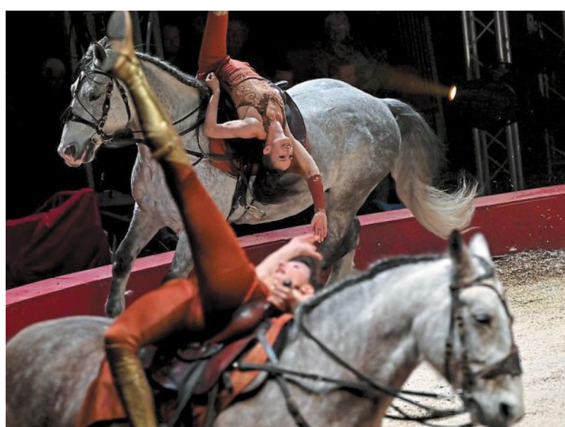
La troupe des cavalières françaises de Nagaïka Tribe remporte le Prix de la Ville de Bayeux.