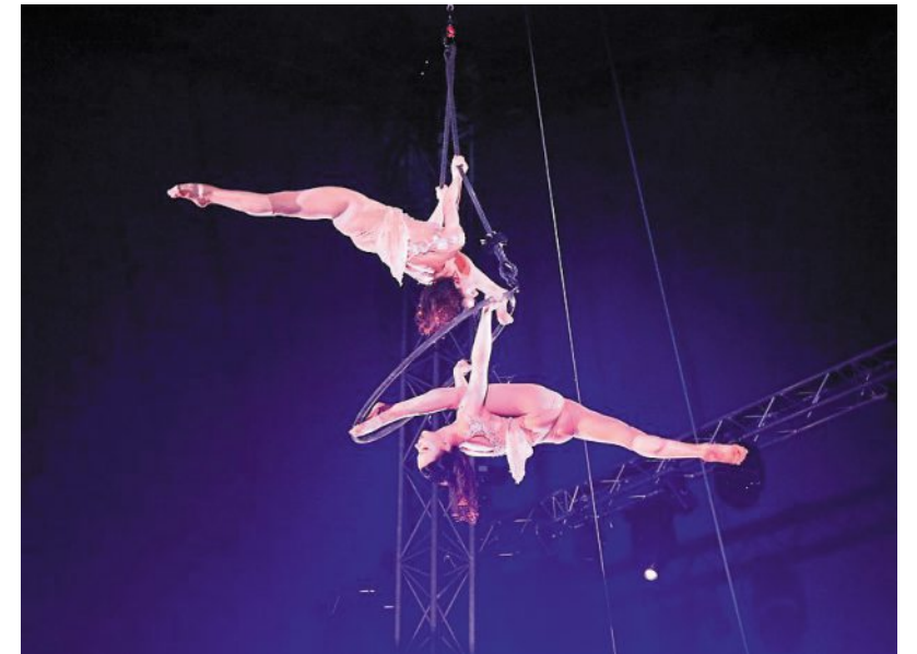
Les jumelles ukrainiennes du Duo Gemini ont présenté un numéro de cerceau aérien tout en poésie et ont eu le Loyal d'argent.