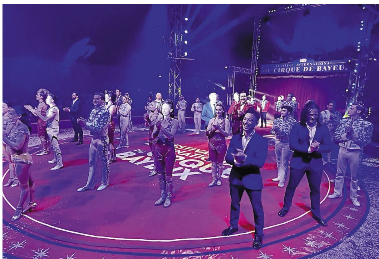
La 10 e édition du Festival international du cirque de Bayeux a offert un spectacle de haute volée. Les spectateurs ne s'y sont pas trompés, cette édition a battu des records de fréquentation.